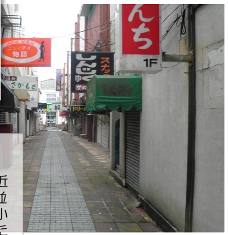
改装前の「白銀小路」