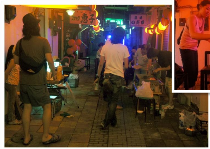
改装後イメージ※改装着手時の「提灯点灯式」の1コマ